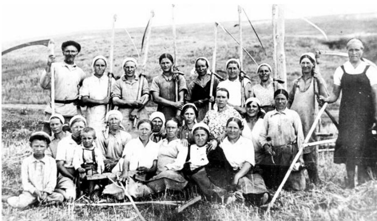
Колхозницы на сенокосе 60 - е года

В былые времена воскресенцы жили на привозном хлебе. Теперь они не только обеспечивают себя всем необходимым, но и продают много хлеба. Вот и в этом году колхоз засыпал в государственные закрома свыше 40000 центнеров хлеба, то есть более двух, годовых планов. Это хороший подарок 3 съезду колхозников.