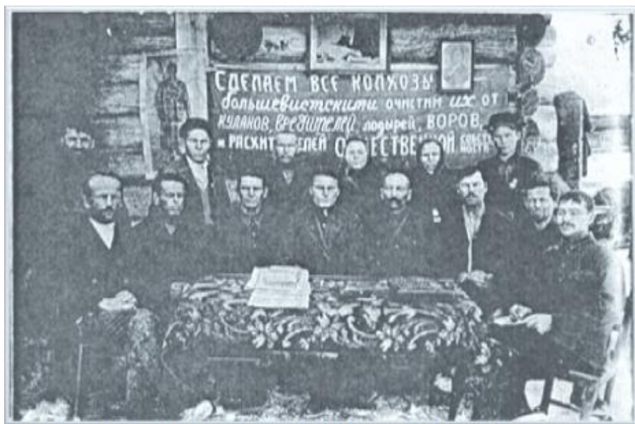
Первое заседание колхоза "Аврора" 1929 год

На своем первом снимке я помещаю фотографию одного из первых заседаний правления колхоза со своим активом. Кстати, опознание участников заседания требует дальнейшего уточнения.