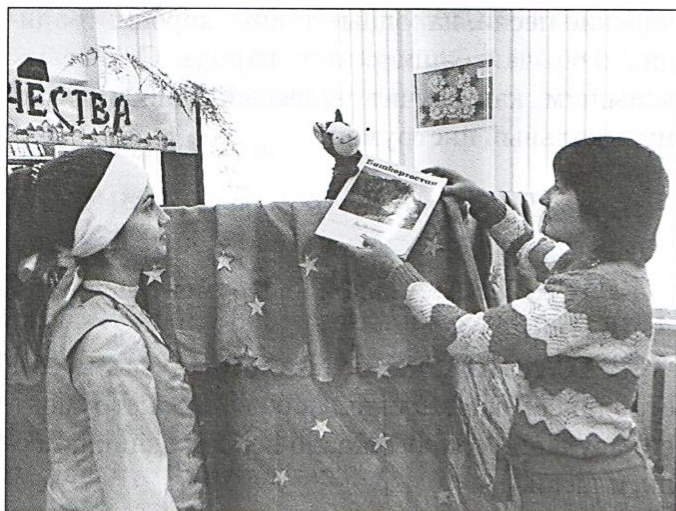
○ Ослик передаёт книгу