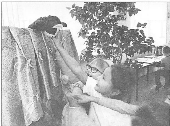
Дети благодарят Ослика