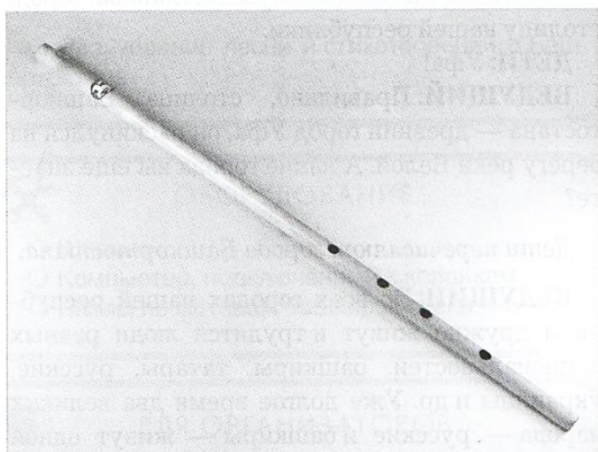
○ Курай — башкирский и татарский духовой музыкальный инструмент