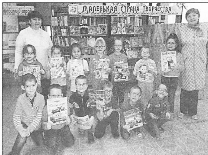
Детский сад комбинированного вида № 24 «Теремок». Офтальмологическая группа