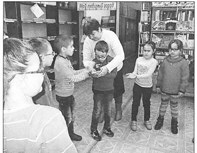
Хоровод под песню «Урожайная»