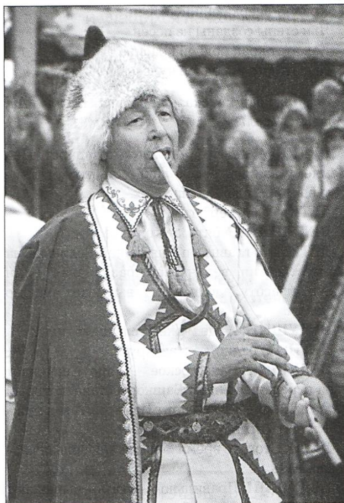
○ Башкир с кураем

Голос птиц, мелодии рассвета — Всё передаёт тростинка эта. Он слов не говорит наверняка, Хотя и голос есть, да нету языка.