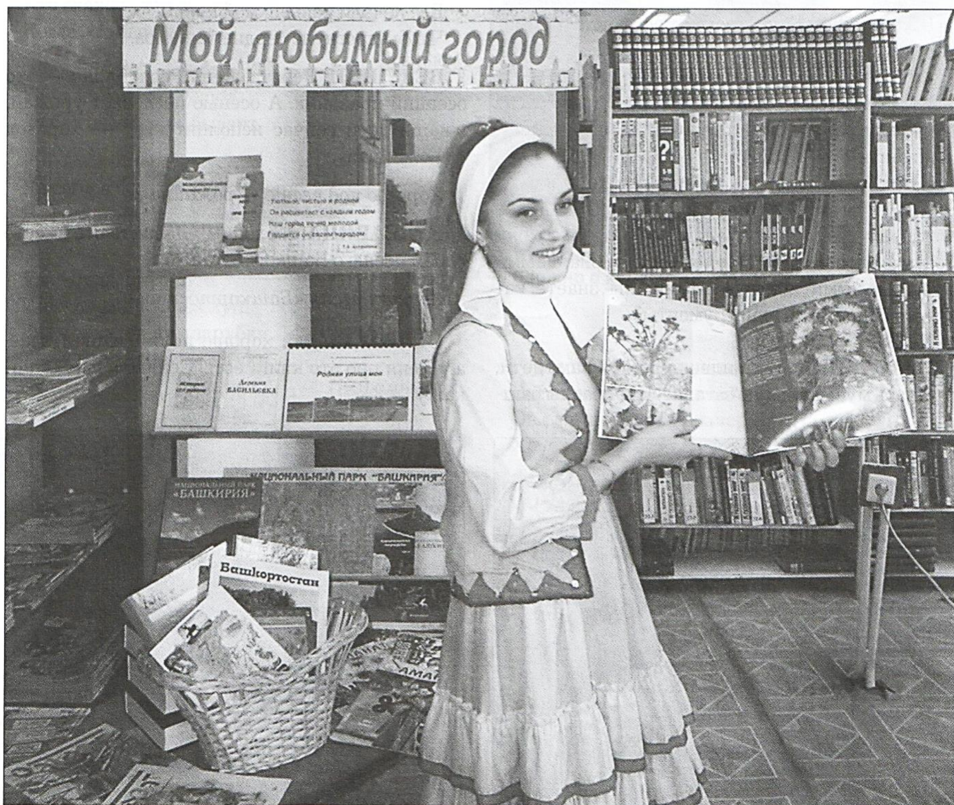
○ Башкирская красавица показывает книгу

ВЕДУЩИЙ: Вот мы и отметили день рождения нашей республики, послушали чудесные мелодии, спели песни, поиграли в игры. На этом наш праздник подошёл к концу. До свидания, ребята, до новых встреч!