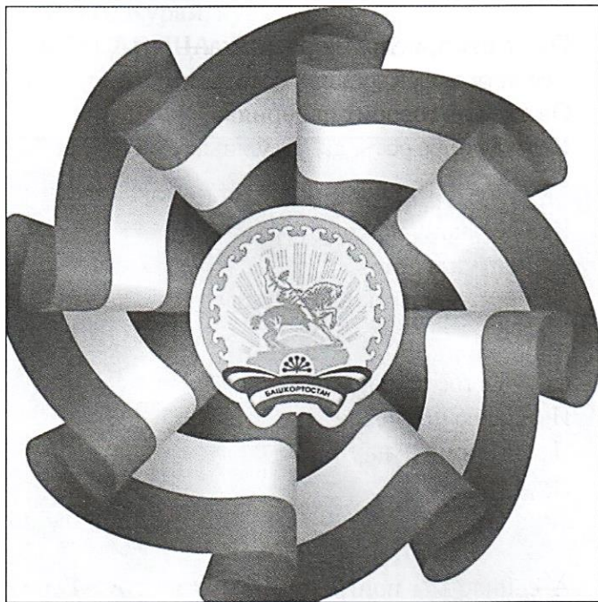
○ Герб Башкортостана в обрамлении флага

ВЕДУЩИЙ: Правильно. Этим выражают дань уважения всему башкирскому народу. Давайте послушаем.